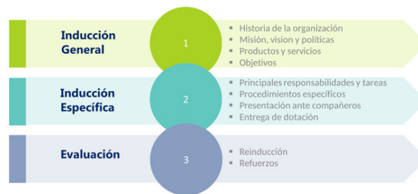
Figura 1. Esquema general del proceso de inducción de personal.