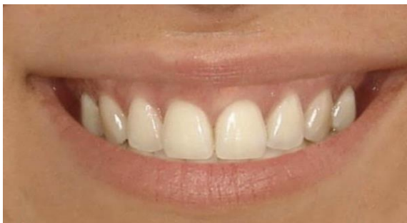
Fig. 1. Sonrisa gingival.