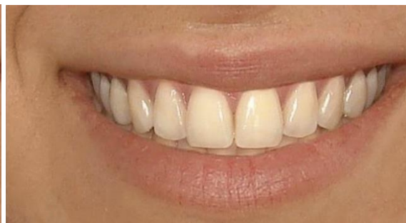
Fig. 2. Sonrisa dental.