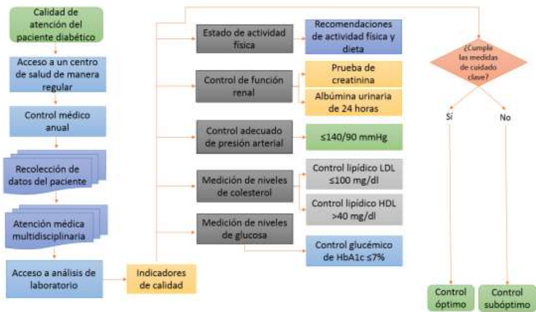
Figura 3. Flujograma de los principales indicadores de calidad de atención.