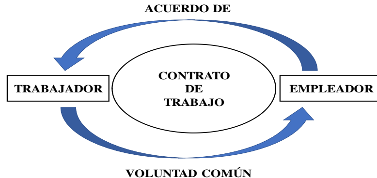
Figura 1: Contrato de Trabajo.

Este elemento del contrato de trabajo es la explicación del compromiso de ambas partes y el plazo en el que serán realizadas las actividades tanto por parte del empleado como por el empleador (De Diego, 2008).