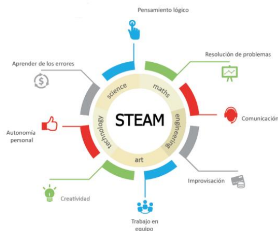
Figura 1: Asignaturas de STEAM

La presencia de la A en el acrónimo STEAM propone una apuesta hacia la creatividad que, aunque es una capacidad intrínseca de las disciplinas STEM, se ve reforzada con la incorporación de la A ya sea desde su significado más estricto (música, pintura, danza, etc.) o más amplio (bellas artes, expresión corporal, humanidades) (Domènech-Casal, 2018).