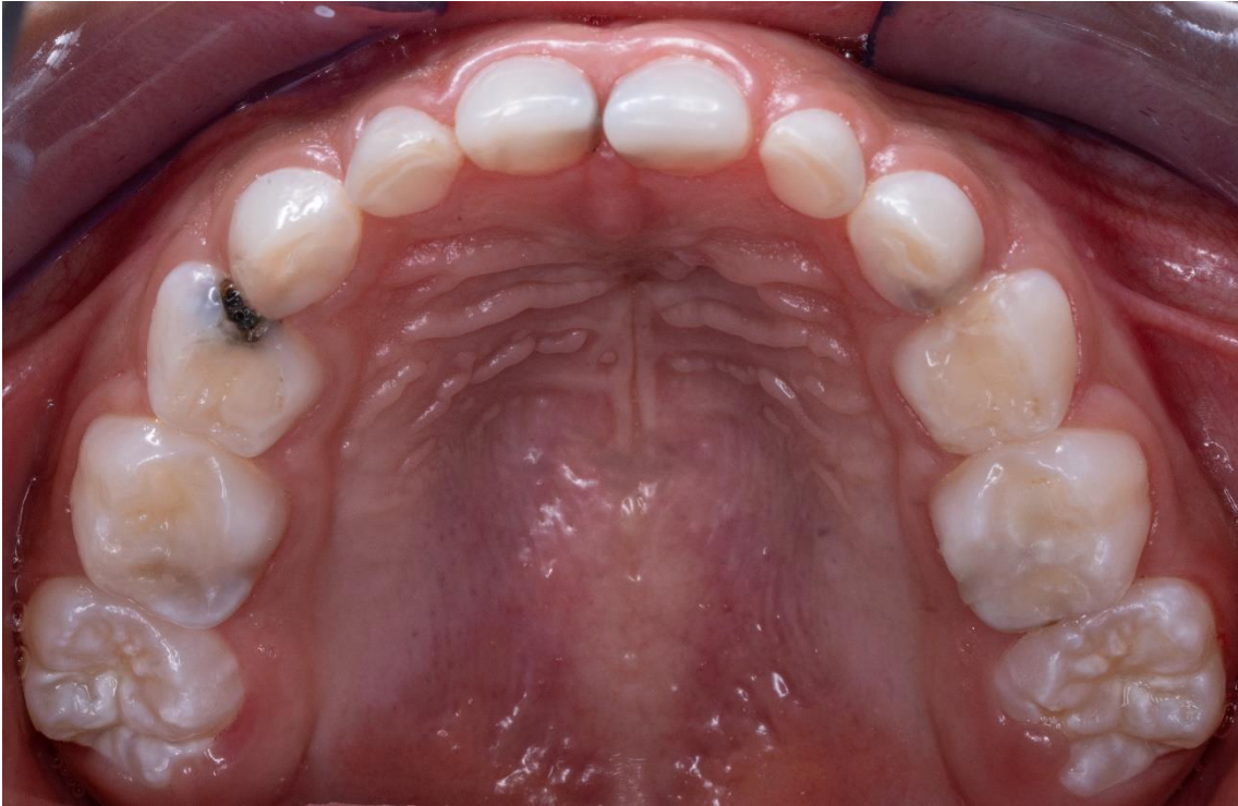
Ilustración 8: fuente autoría Od. Esp. Paúl Vergara, foto oclusal superior después del tratamiento.