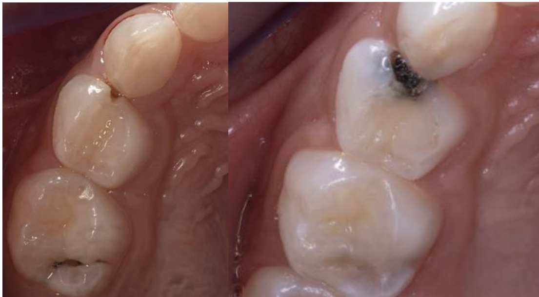
Ilustración 4: fuente autoría Od. Esp. Paúl Vergara: aplicación de fluoruro diamino de plata para la detención de caries.