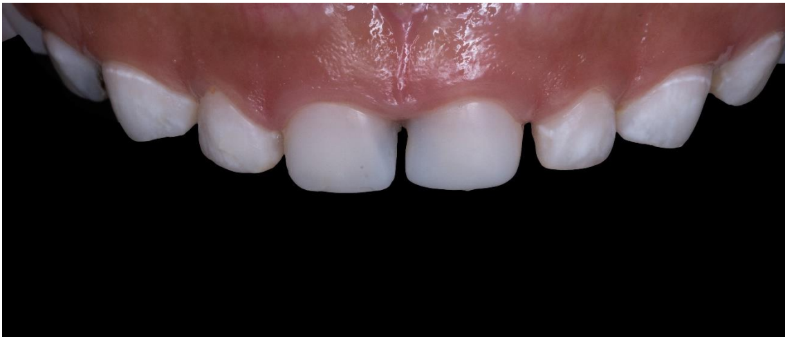
Ilustración 11: fuente autoría Od. Esp. Paúl Vergara Sarmiento.