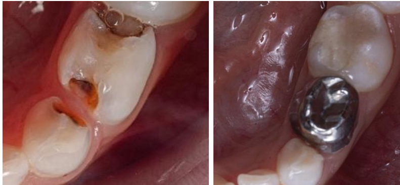
Ilustración 6: Restauración con técnica Hall. ANTES Y DESPUES del procedimiento.