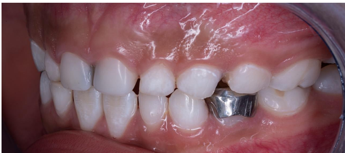
Ilustración 14: fuente autoría Od. Esp. Paúl Vergara Sarmiento.