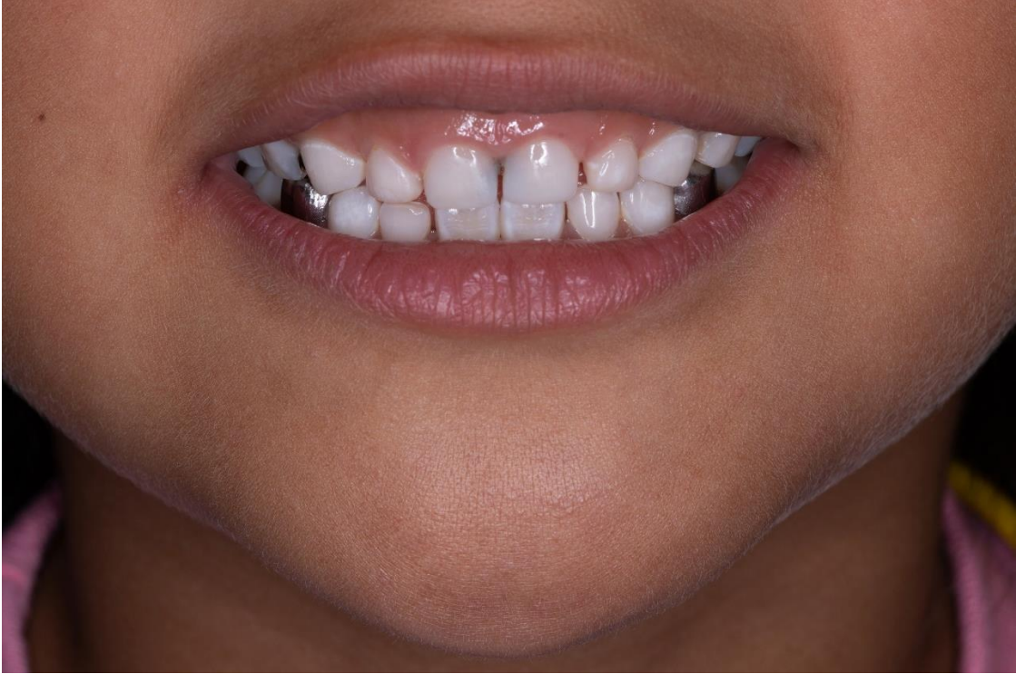
Ilustración 10: fuente autoría Od. Esp. Paúl Vergara, foto del paciente sonriendo después del tratamiento.