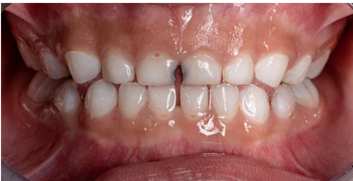
Ilustración 3: fuente autoría Od. Esp. Paul Vergara: fotografía frontal.