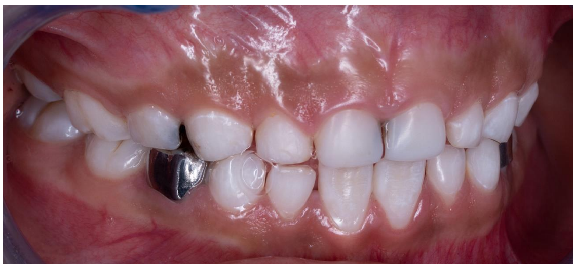
Ilustración 13: fuente autoría Od. Esp. Paúl Vergara Sarmiento.