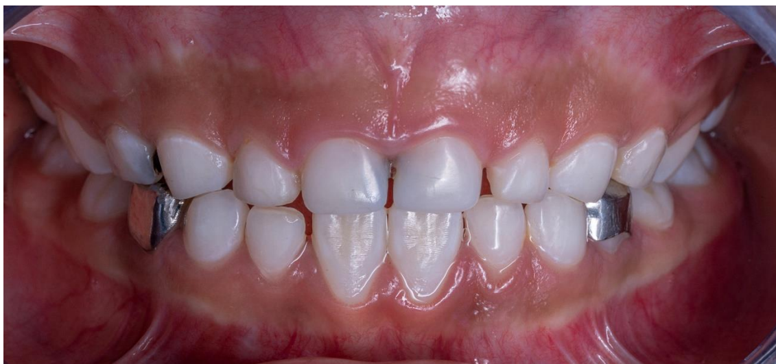
Ilustración 12 fuente autoría Od. Esp. Paúl Vergara Sarmiento.