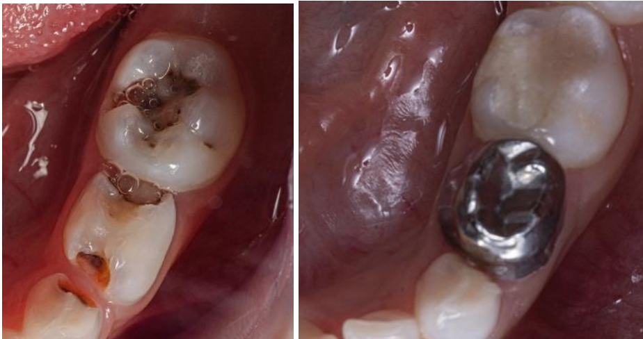
Ilustración 5: fuente autoría Od. Esp. Paúl Vergara: Restauración con técnica TRA en las piezas 73 y 75, usando ionómero de alta viscosidad de autocurado. ANTES Y DESPUES del procedimiento.