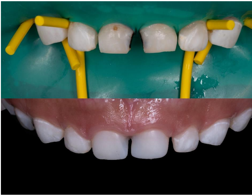
Ilustración 7: fuente autoría Od. Esp. Paúl Vergara: Restauraciones con coronas de celuloide preformadas. ANTES Y DESPUES del procedimiento.