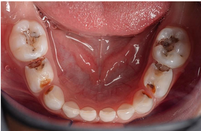
Ilustración 2: fuente autoría Od. Esp. Paul Vergara: fotografía oclusal arcada inferior