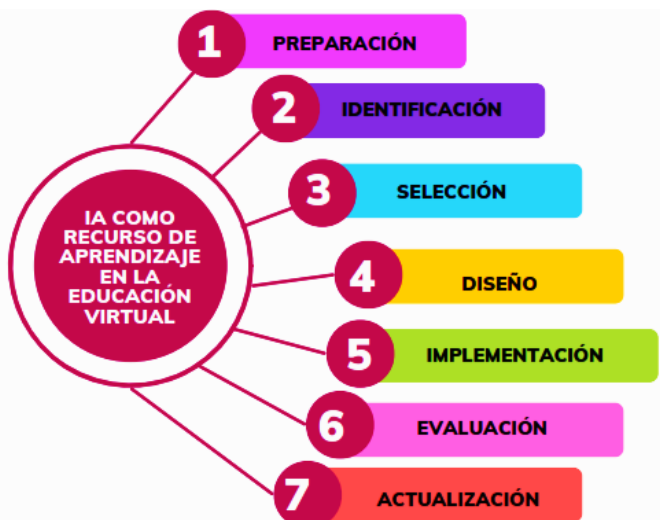
Figura 2. IA como recurso de aprendizaje en la educación virtual.

El objetivo de esta propuesta es explorar la integración de la Inteligencia Artificial (IA) como recurso de aprendizaje en la educación virtual para mejorar las estrategias y metodologías docentes. La IA ofrece un potencial significativo para optimizar la enseñanza y el aprendizaje, permitiendo a los educadores adaptar el contenido, personalizar la experiencia de los estudiantes y brindar retroalimentación oportuna. La propuesta se centra en la implementación de herramientas de IA, como asistentes virtuales, análisis de datos educativos y sistemas de recomendación, para apoyar a los docentes en la planificación, ejecución y evaluación de las actividades educativas en entornos virtuales.