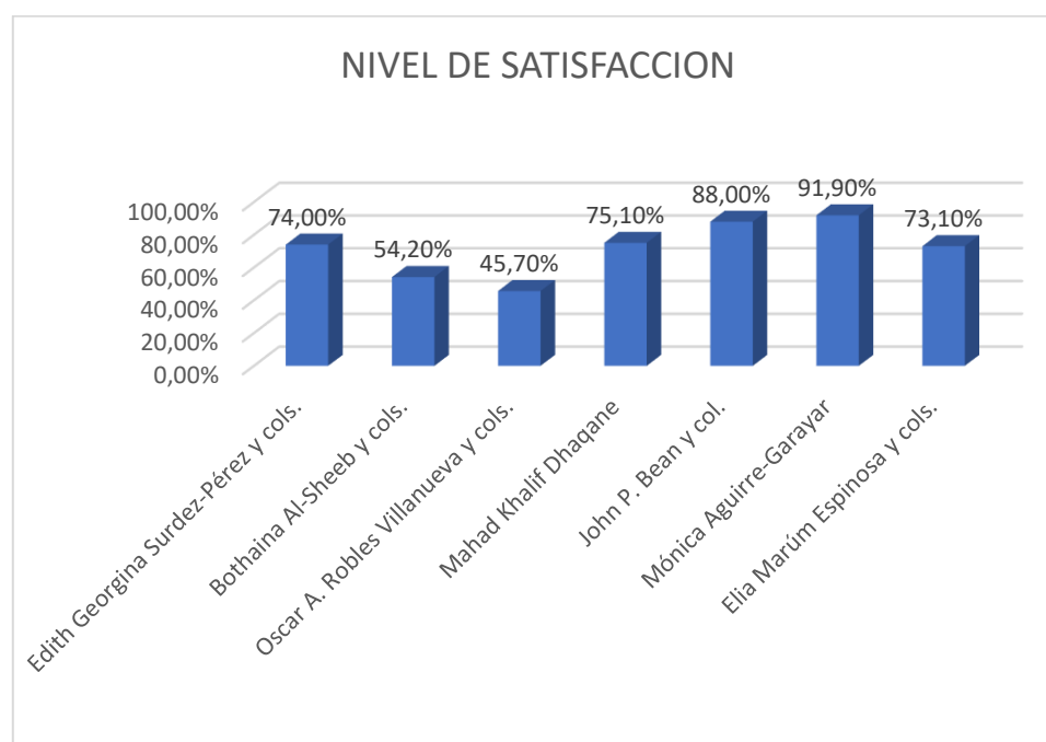
Ilustración 2 Ilustración en Barras de los porcentajes según los autores analizados.