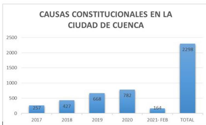
Gráfico 1 Causas Constitucionales

En la gráfica número 1 se muestran las causas constitucionales ingresadas por años y el número de las mismas.