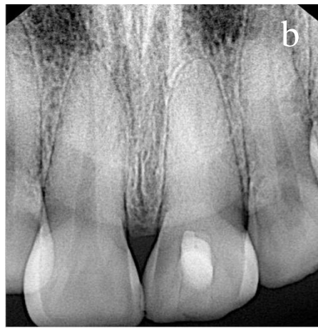
Figura 1 a) y b) Radiografía de fractura del tercio medio de la raíz