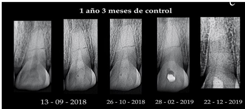
Figura 3 e) Radiografía intraoral periapical 15 meses después del trauma.