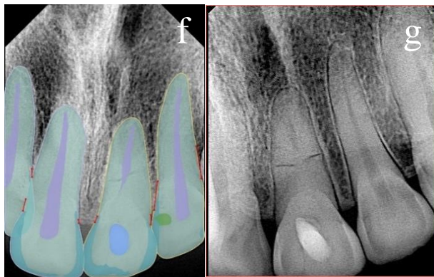
Figura 4 f) y g) Radiografía intraoral periapical 70 meses después del trauma.