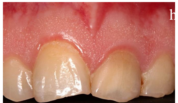
H) Fotografía intraoral de la mucosa oral 70 meses después del trauma.