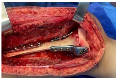
Imagen 7 Fijación proximal y distal mediante tornillos canulados y placas.