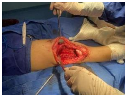
Imagen 5 Resección del tejido anormal o célula cancerosa.

El plan terapéutico del osteosarcoma GIII de fémur derecho que presentaba la paciente fueron tratados en base a una intervención quirúrgica en donde se realizó una resección con márgenes en donde se extirpó el tejido que se encontraba afectado eliminando cualquier tejido anormal o célula cancerosa (Imagen 5). De igual manera se hizo una resección epifisaria de 0.5cm de la epífisis que constaba en eliminar una parte de la porción terminal del hueso, posteriormente se utilizó un aloinjerto de radio distal de un adulto (Imagen 6). Se realizó una fijación proximal mediante una placa de 3.5mm y una fijación distal con tornillos canulados 4.0mm y doble placa (Imagen 7).