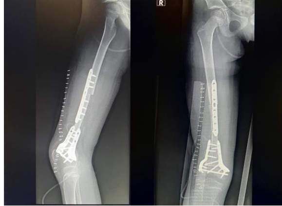
Imagen 8 Radiografía donde muestra consolidación del aloinjerto de hueso de cadáver.

tratamiento realizado a la paciente fue excelente, sin embargo, la tolerabilidad fue un problema debido a que no tolero la quimioterapia generando como efectos adversos una toxicidad por quimioterapia.