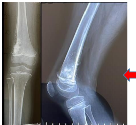
Imagen 1 Osteosarcoma de fémur derecho

Radiología reporta osteosarcoma de fémur con lesión en la metáfisis distal del fémur derecho con invasión parcial a la epífisis (Imagen 1). En la tomografía computarizada de tórax muestra que no hay actividad metastásica pulmonar. En la resonancia magnética se evidencia una lesión de aspecto maligno que mide 72 x 60mm, localizada en metáfisis distal del fémur, con erosión cortical y formación de osteoide (Imagen 2). En la biopsia hay presencia de osteosarcoma GIII de fémur derecho, libre de metástasis pulmonares. Tras valoración de la osteointegración radiológica según la escala ISOLS (International Symposium on Limb Salvage) la paciente presenta una buena osteointegración radiológica mayor a 75% (Imagen 3).