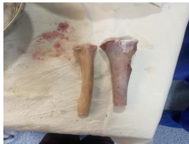
Imagen 6 Aloinjerto de radio distal de un adulto.