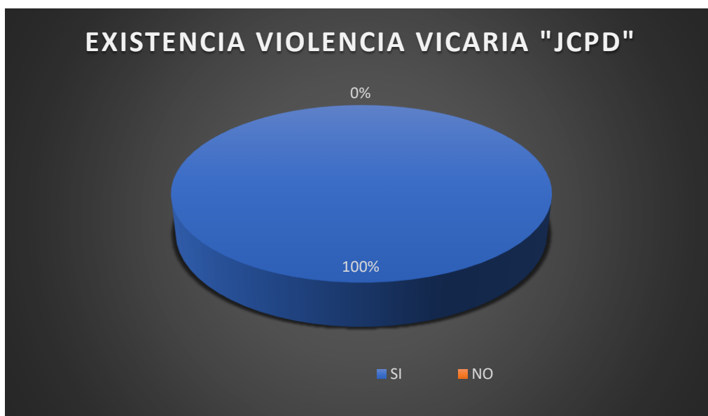
Ilustración tabla Nro. 2