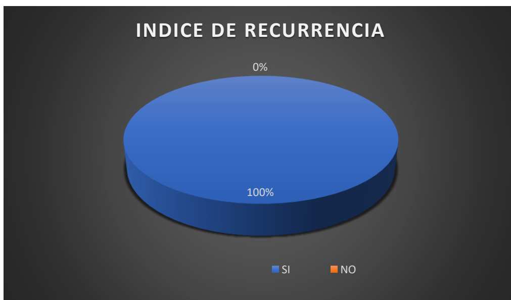
Ilustración tabla Nro. 3