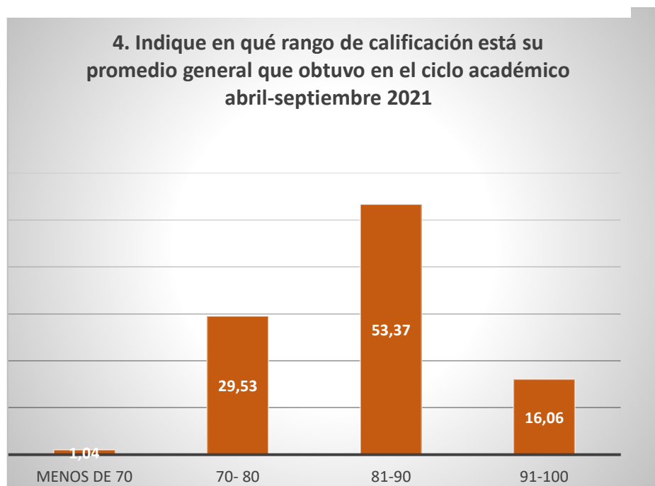
Gráfico 1: Promedio General