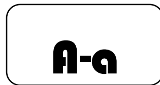
Subtítulos o texto