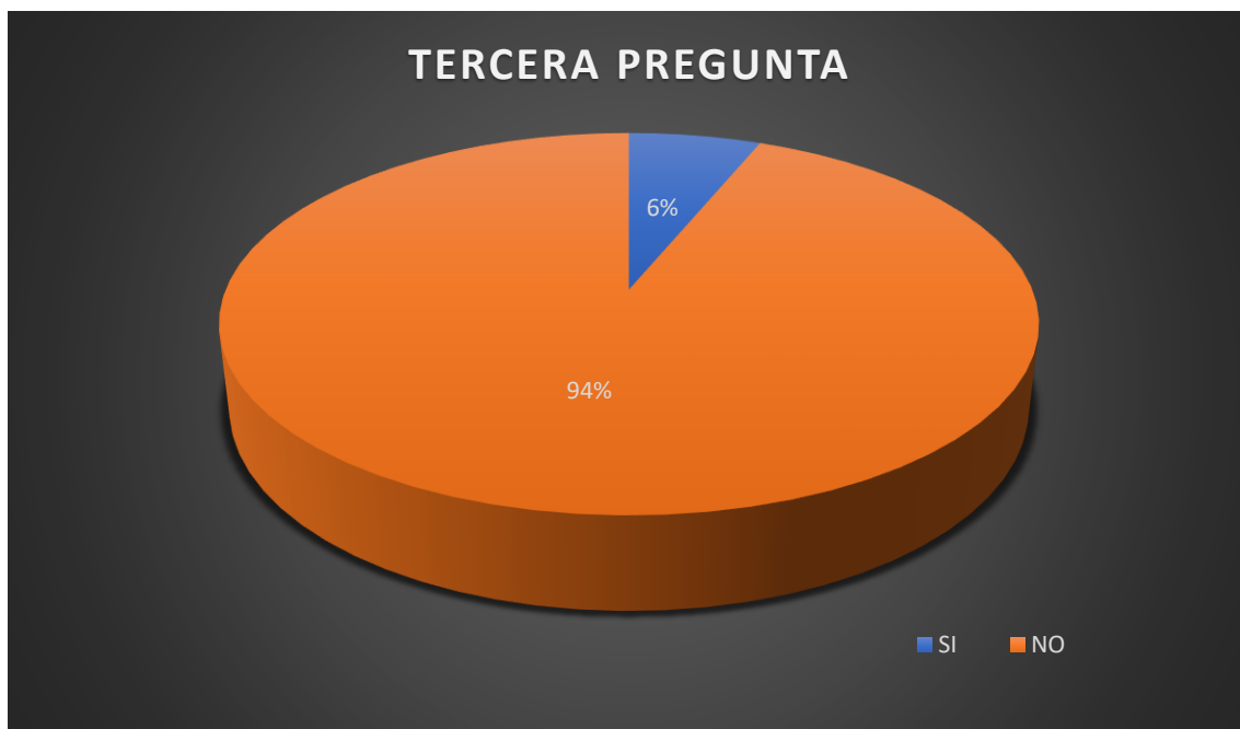
Ilustración tabla Nro.3