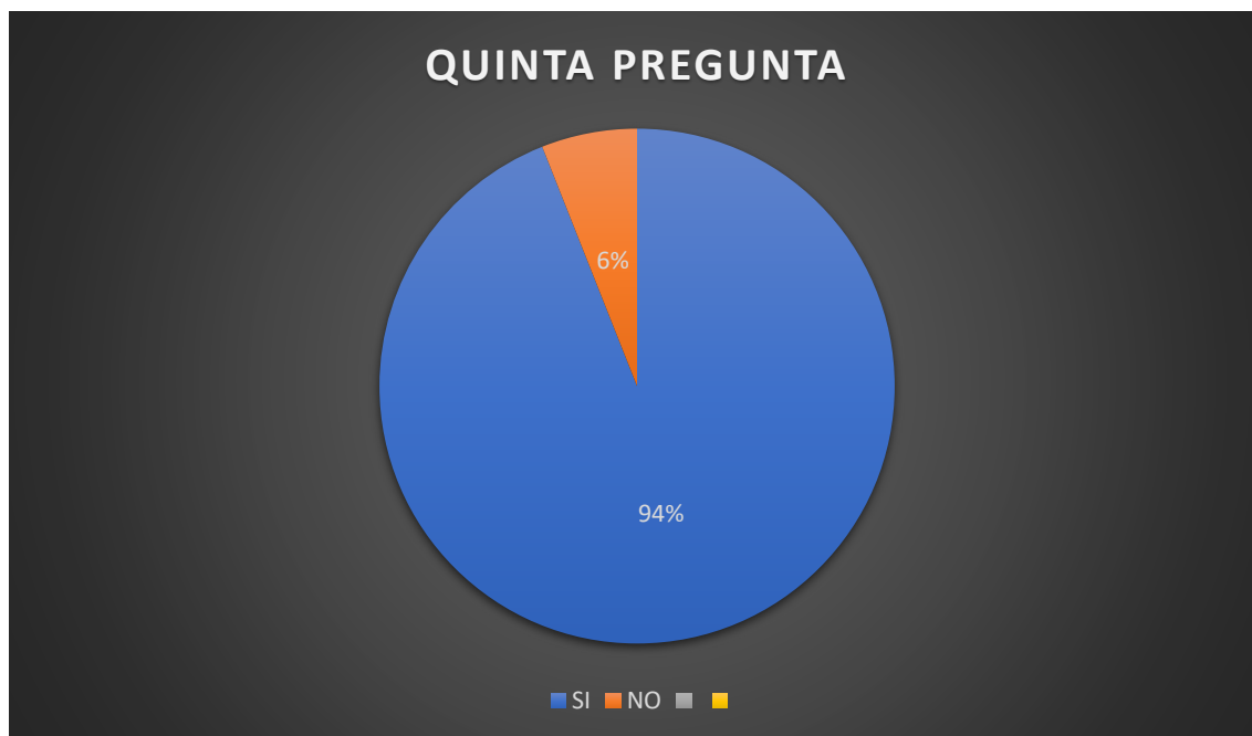
Ilustración tabla Nro. 5