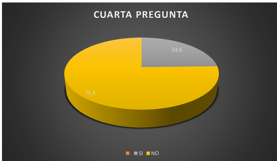
Ilustración tabla Nro.4