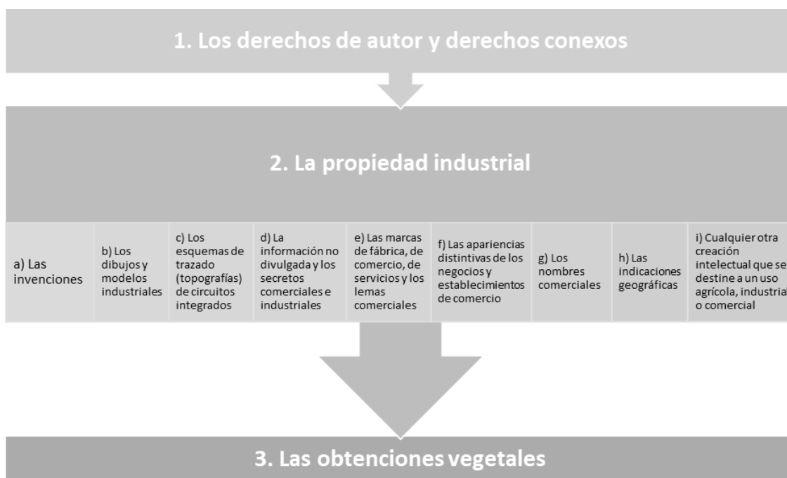
Figura 1 Tipos de Propiedad Intelectual