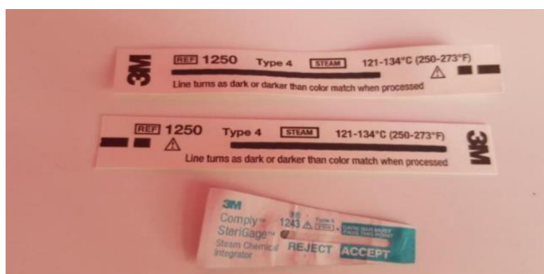
Gráfico 2 Tira indicadora 3MMR ComplyMR 1250/ Integrador químico 3MR ComplyMR SteriGageMR 1243

Nota: Aceptado/Rechazado Autoclave F; Semana 1