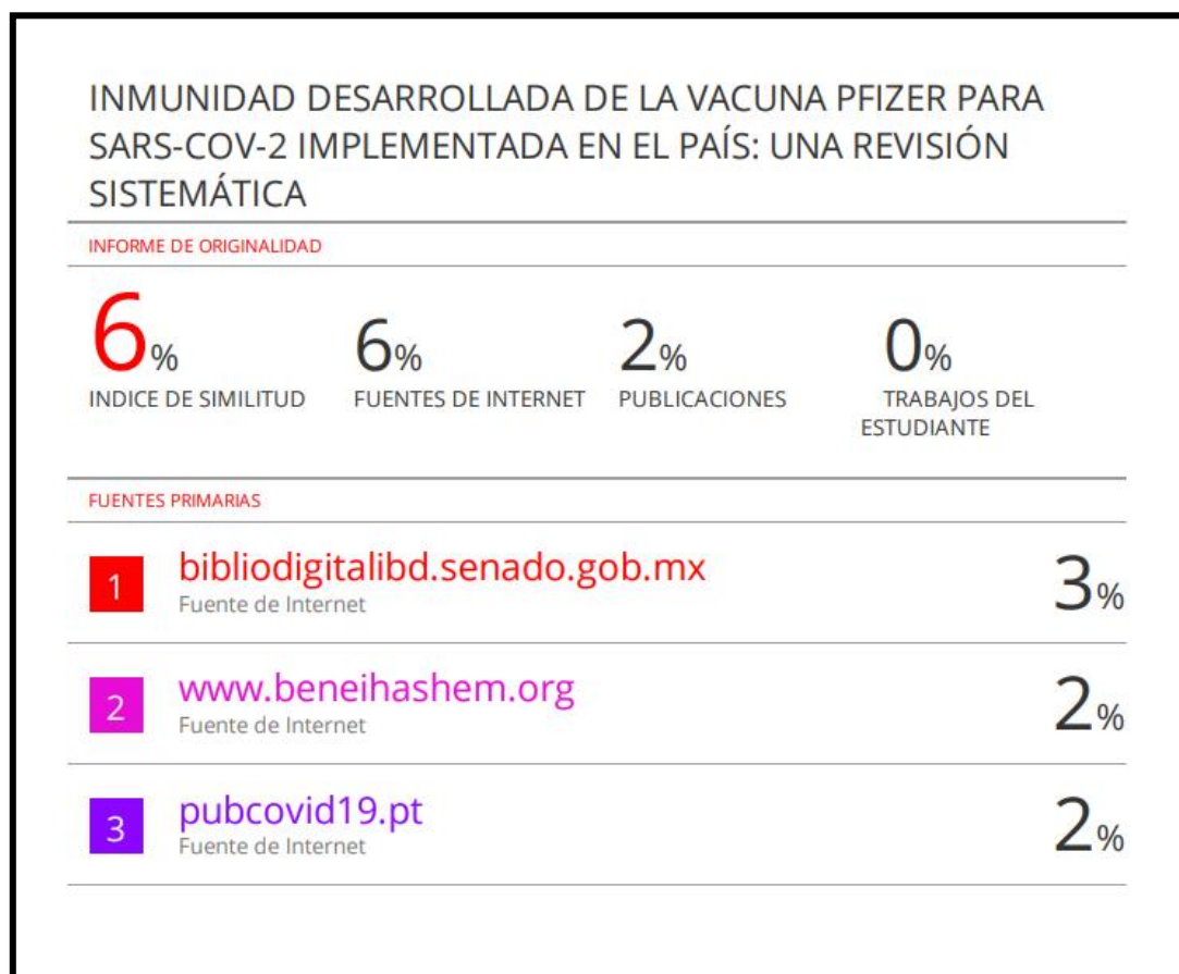
Fig. 1.- Índice de similitud