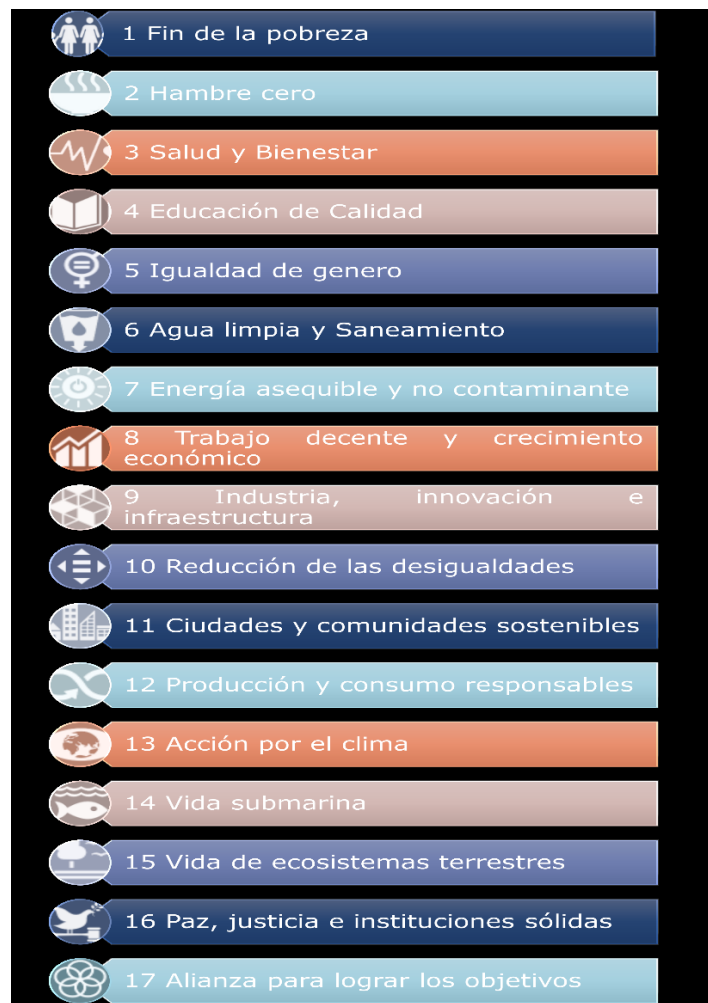
Figura 1: Objetivos de Desarrollo Sostenible