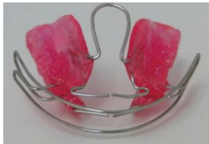
Figura 3: Activador elástico abierto de Klammt.

El funcionamiento de este aparato se da por la interrelación que otorga la fuerza del organismo del paciente más las fuerzas intrínsecas de la musculatura al realizar actividades normales como masticar, hablar, deglutir, etc. Aumentando así la actividad muscular por lo tanto promoviendo al crecimiento y desarrollo de los maxilares. (21)