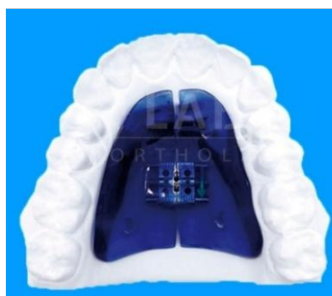
Figura 5: Placa activa.

La placa activa está compuesta por plano metálico, 2 retenedores Adams, 1 arco deslizante de acero, puede llevar un tornillo de expansión, que se activa 1 vez al mes para trabajar de acuerdo con el crecimiento y desarrollo. (20)