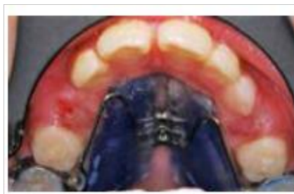
Figura 9: Expansor de Hass.

Es un aparato utilizado en pacientes para la corrección de problemas transversales del maxilar, especialmente utilizados en mordidas cruzadas posteriores, está compuesta por la combinación de una parte metálica activa con partes acrílicas que se apoya en el paladar permitiendo una expansión controlada y gradual mediante las activaciones de un tornillo central. (25)