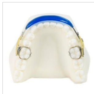
Figura 2: Lip Bumper.

Es normalmente usado cuando se combina con aparatología fija con el objetivo de tener un cambio o una guía para protruir las piezas dentales anteroinferiores, y por la fuerza normal de la lengua logramos dicha protrusión, esta confeccionado con una parte de acrílico que va en la parte vestibular de dientes inferiores. (20)