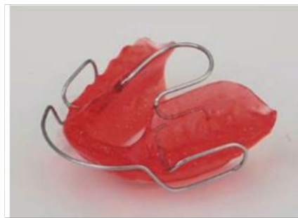
Figura 1: Bionator tipo II.

Son aparatos bimaxilares pequeños que nos ayuda con un cambio postural terapéutico, se colocan en las caras linguales de molar a molar, se extiende al maxilar de canino a canino y acrílico en caras oclusales desde las cúspides linguales y a cuatro milímetros de los procesos alveolares, tiene un resorte palatino llamado coffin que mantiene la lengua en el paladar impulsando el crecimiento del maxilar, además tiene el arco vestibular. (6,16)