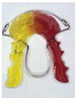
Figura 4:Activador de Andreasen Haupl.