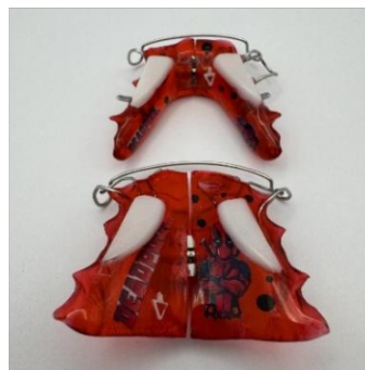
Figura 7: Pistas Planas.

Son dispositivos usados guiar el desarrollo del sistema estomatognático y para rehabilitación neuro oclusal (RNO) fueron desarrolladas por el Doctor Pedro Planas de uso bimaxilar para corregir discrepancias oclusales, su diseño permite estimular de una forma controlada.(23)