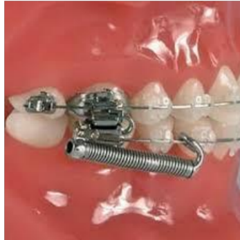
Figura 8: Forsus.

Es un dispositivo usado principalmente para la corrección de discrepancias esqueléticas de clase II actuando mediante la aplicación de fuerzas continuas en sentido anteroposterior. Se fija en el primer molar superior y en el molar inferior, está compuesto por resorte helicoidal superelástico con el material níquel-titanio su diseño tiene un mecanismo de pistón que ayuda a realizar movimientos controlados. (24)