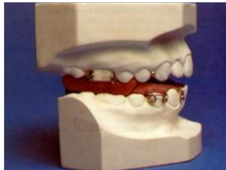
Figura 6: Bloques gemelos.

La recomendación para la obtención de mejores resultados de cualquier aparato ortopédico es que se use el mayor tiempo posible ya que es un aparato de adaptación rápida estimulando al máximo el desarrollo para la corrección la relación esquelética y dental. (15)