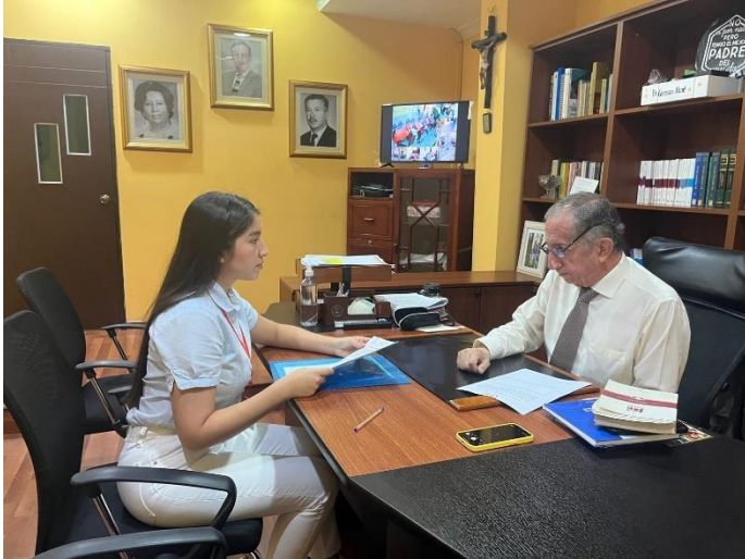
Entrevista – Notario Primero del cantón La Troncal