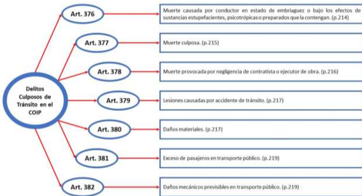
Figura 2 Delitos Culposos de Tránsito