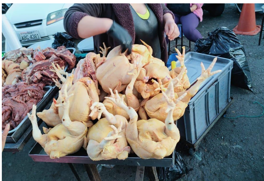
Figura 1 Puesto ambulante de expendio de pollo.

El universo de estudio estuvo conformado por todos los puestos ambulantes de expendio de pollo crudo, que se expenden en un mercado de la ciudad de Cuenca, provincia del Azuay; a partir de ello, se tomó una muestra probabilística de 30 puestos de expendio de pollo crudo y cuya selección fue aleatoria. La captación de las observaciones se apoyó en otras variables, tales como: las muestras de pechuga de pollo crudo y los puestos que comercializan pollo crudo de manera ambulante en el mercado numerados del 1 al 30.