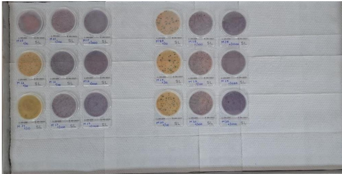
Figura 6 Organización y resultados de las muestras de pechuga de pollo crudo según diluciones (muestras 25–30)