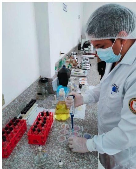
Figura 3 Preparación de los medios de cultivos en las placas compact dry