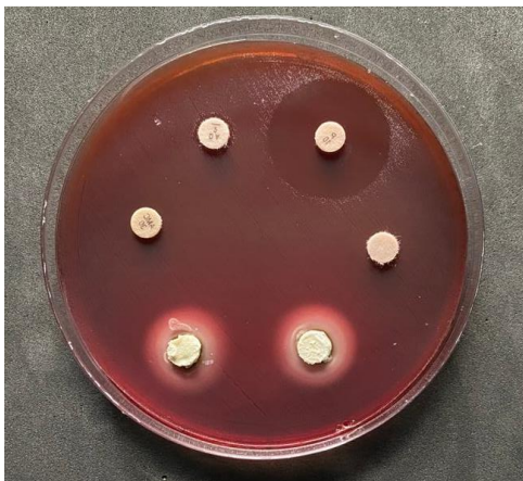
Figura 6 Medición de los halos de inhibición formados por la acción del \text{Ca(OH)}_2 frente al E. faecalis cepa ATCC 29212.