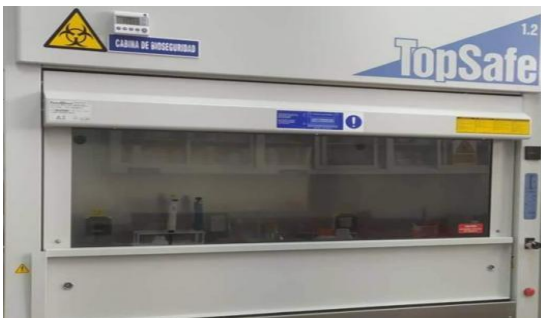
Figura 1 Cámara de flujo/bioseguridad donde se preparó las cajas Mono Petri.