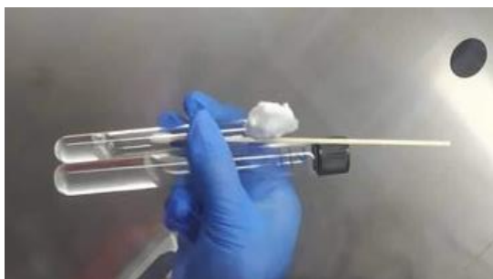
Figura 3 Preparación de la muestra, turbidez de McFarland.