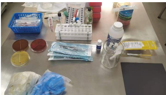
Figura 2 Materiales utilizados en el estudio.