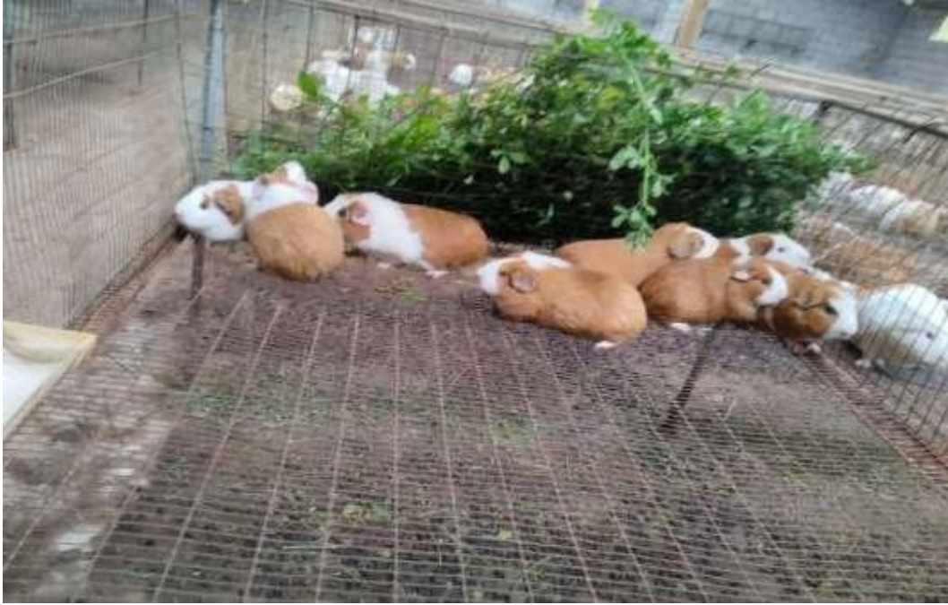
Fotografía 4. Alimentación exclusiva con alfalfa en prefloración