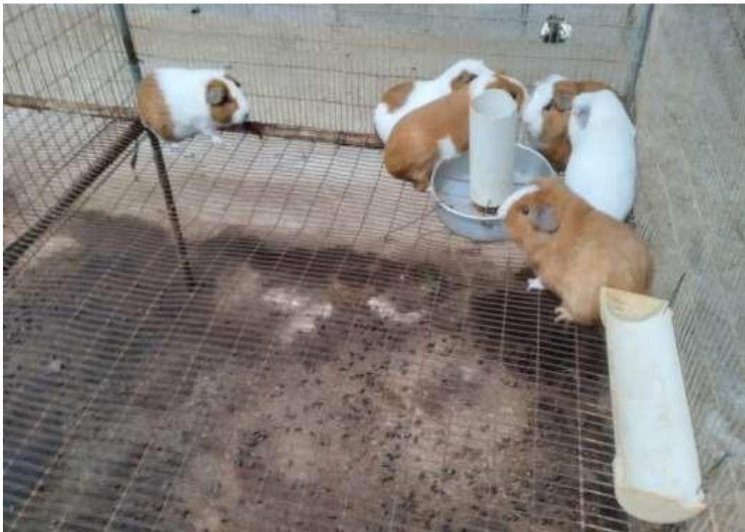
Fotografía 5. Alimentación exclusiva con balanceado libre de alfarina