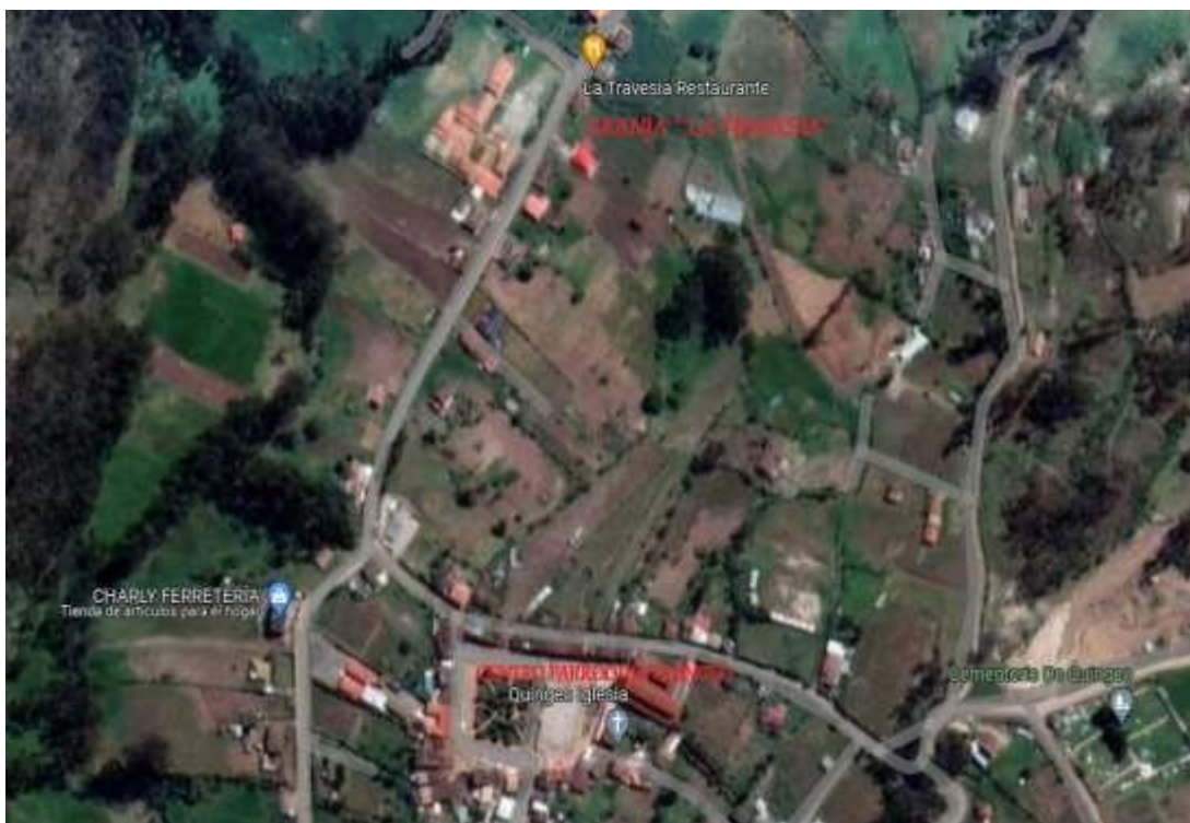
Figura 1. Mapa satelital, ubicación geográfica Granja “La Travesía”, Parroquia Quingeo, Cantón Cuenca.

El presente trabajo de investigación se realizó en la granja “La Travesía” localizada en la parroquia Quingeo del Cantón Cuenca, provincia Azuay, Ecuador. Azuay está ubicado entre la latitud: 2° 53’ 57" sur y longitud 79° 00’ 55" oeste; a una altitud aproximada de 2.560 metros encima del nivel de mar, con una temperatura que oscila entre 7 a 15 °C en invierno y 12 a 25 °C en verano. La parroquia Quingeo se ubica geográficamente a una altura de 2.640 metros sobre el nivel del mar y cuenta con un clima templado andino de 16,3 °C de temperaturas anuales en promedio.