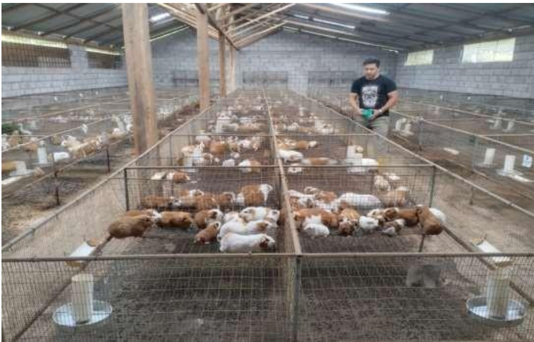
Fotografía 3. Selección de unidades experimentales