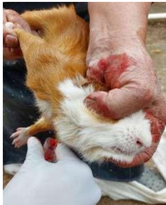
Fotografía 7 y 8. Faenamiento y recolección de muestras en unidades experimentales