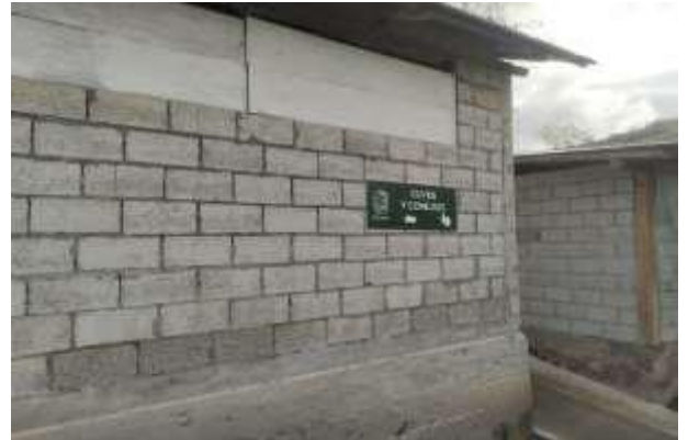
Fotografías 1 y 2. Galpón de cuyes. Granja “La Travesía”. Parroquia Quingeo