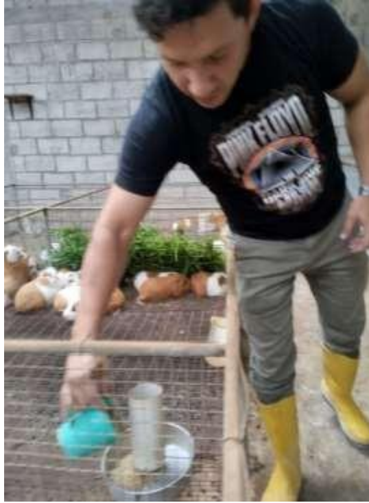
Fotografía 6. Alimentación mixta con balanceado libre de alfarina y alfalfa en prefloración